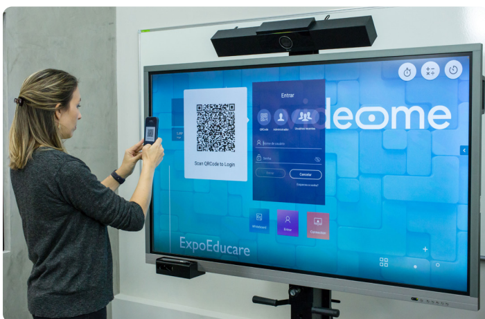
Permite que cada professor tenha um perfil personalizado