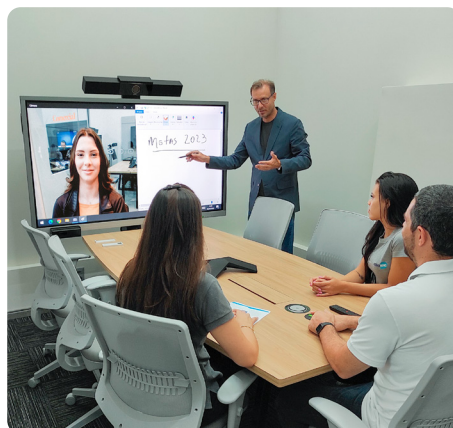
Reuniões de diretoria e professores