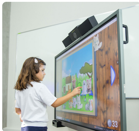
Jogos e atividades educacionais