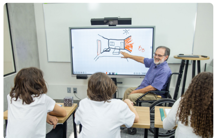
Inclusão e acessibilidade com o ajuste de altura