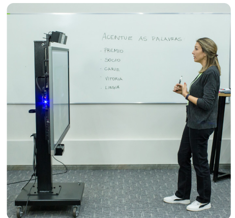
Criação de conteúdo ao vivo / gravado