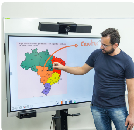
Aulas dinâmicas com interatividade