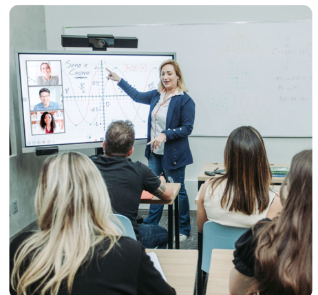
Reuniões de pais híbridas